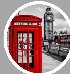
SERVEIS A DESTINACIÓ