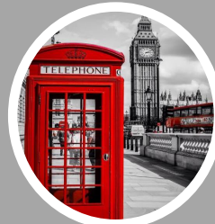
SERVEIS A DESTINACIÓ