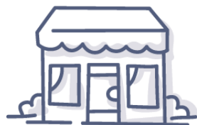
Pimes i grans empreses