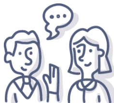
Autònoms i autònomes