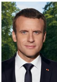
Emmanuel Macron République française – President