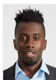
Blaise Matuidi Origins Fund – General Partner and Co-founder