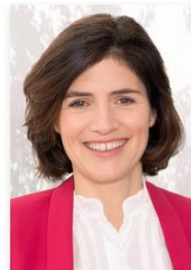
Christel Heydemann Orange – CEO