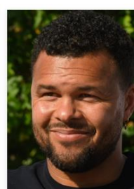
Jo-Wilfried Tsonga All in Group – Co-Founder & Former ATP Tour professional tennis player