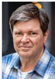
Yann LeCun Meta & NYU – Chief AI Scientist