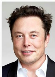
Elon Musk Tesla, SpaceX, Twitter