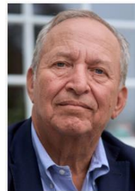
Lawrence H. Summers Charles W. Eliot University & Harvard University – Professor & President Emeritus