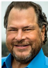
Marc Benioff Salesforce – Chair, CEO & Co-Founder