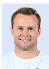
Alexis Pinturault ALEXSKI – Alpine skier