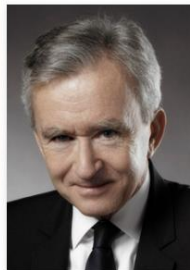
Bernard Arnault LVMH – Chairman & Chief Executive Officer