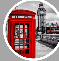
SERVEIS A DESTINACIÓ