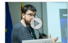
Intech 3D: fassessor en impressió 3D