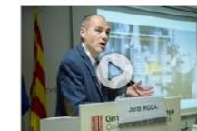
Optim Learning, formació per al sector industrial