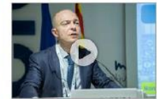
Grap Giti: integració de tecnologies per a la Indústria 4.0