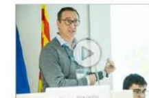
Traccion, els dispositius que monitoritzen les plantes industrials