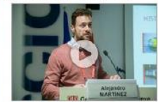
Eivores: els AGA's per a la Indústria 4.0