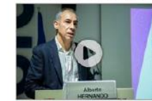
Wersabot, el robot col·laboratiu

La Indústria 4.0 avança a passos gegants per millorar processos i productes de les fàbriques del futur. Les últimes solucions que s'estan implementant a Catalunya, amb casos reals de proveïdors punteres, s'han presentat a la sessió Marketplace de solucions Indústria 4.0 a ACCIÓ amb l'objectiu d'oferir una fotografia actualitzada del que, a principis del 2019, està passant al nostre país.