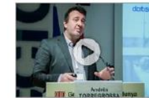
Datiwin, la intel·ligència artificial aplicada a la indústria