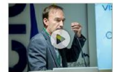
Sistema Software: la visualització de dades enriquecida a l'I4.0